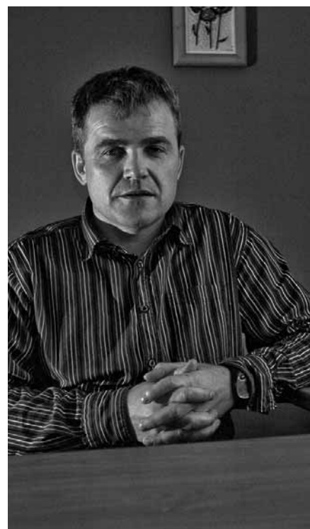
"Imam ideje, ki so morda preveč revolucionarne ..."

Seveda pa je to tako zelo širok spekter, da se je težko primerjati. Pri določenih