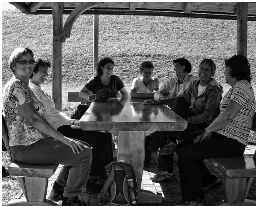
Sekcija računovodij pri OOZ škofja Loka na enem od svojih pohodov.

Lahko delaš tako kot pravi Davčna uprava in potem nimaš težav z njihovim pregledom. Če pa to tebi ne ustreza, pa poskušaš spraviti skozi svojo varianto. Moraš pa imeti pogum. V omenjenem primeru mi je na koncu najbolj ustrezal